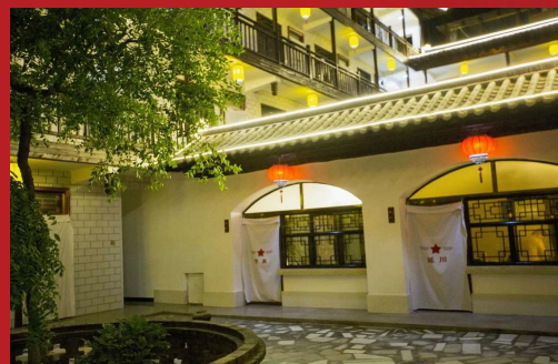
红军窑洞主题风格