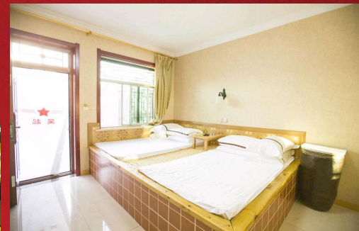
红军时期主题双人炕