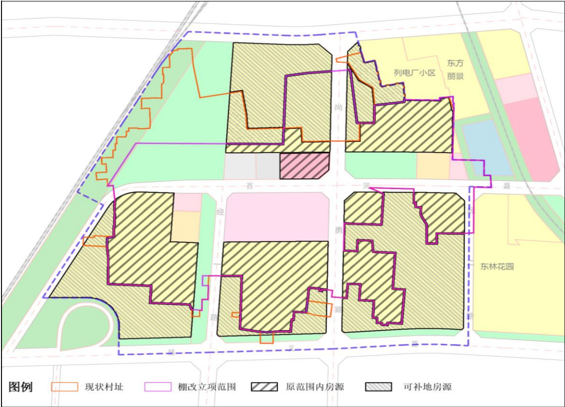
西河项目地块用地统计表