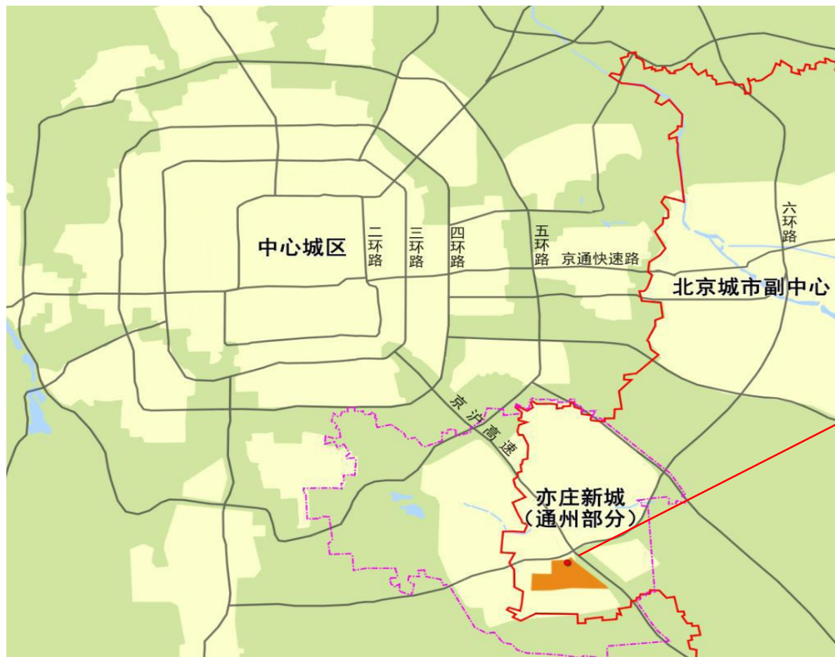
项目位于亦庄新城通州部分中关村金桥科技产业基地（VII-4 街区）内

□ 远洋马驹桥产业园位于北京通州区马驹桥镇，中关村金桥科技产业基地（VII-4 街区）内，京沪高速与西南六环路的交汇处的西南角。