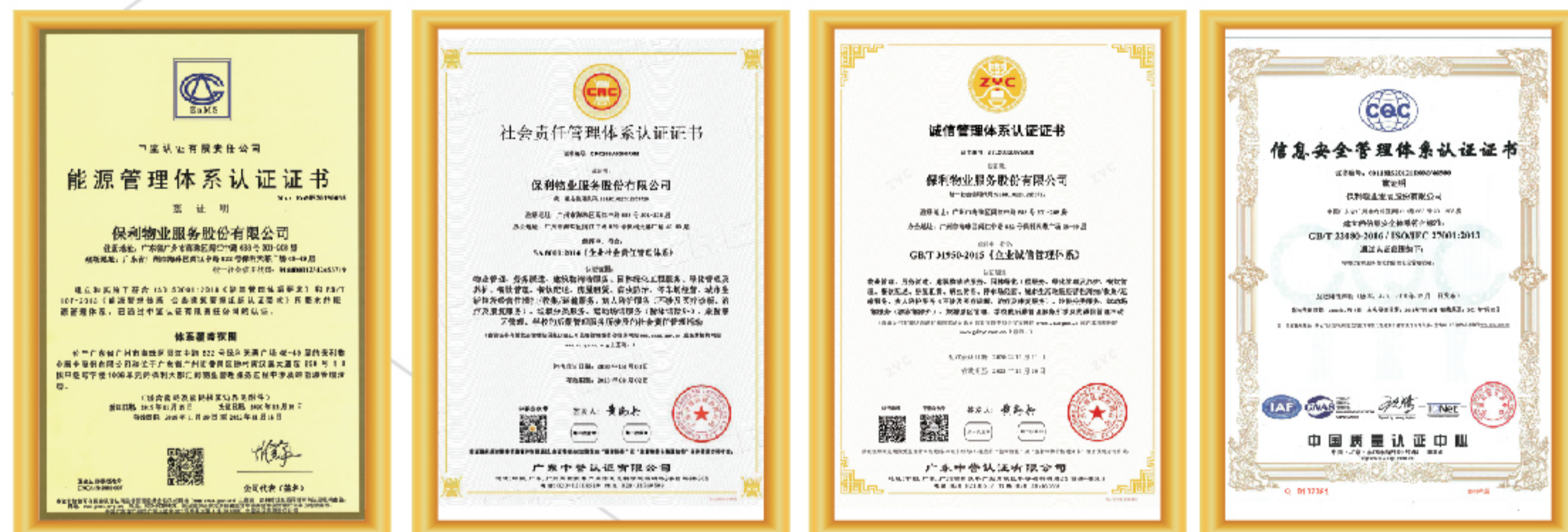
能源管理体系证书