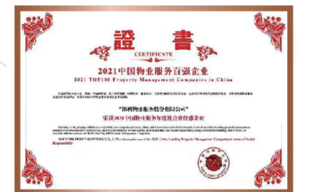
2021年 中国物业服务年度 社会责任感企业