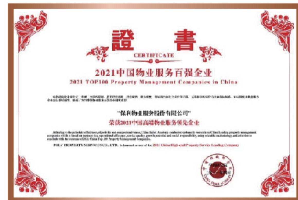
2021年 中国高端物业服务 领先企业