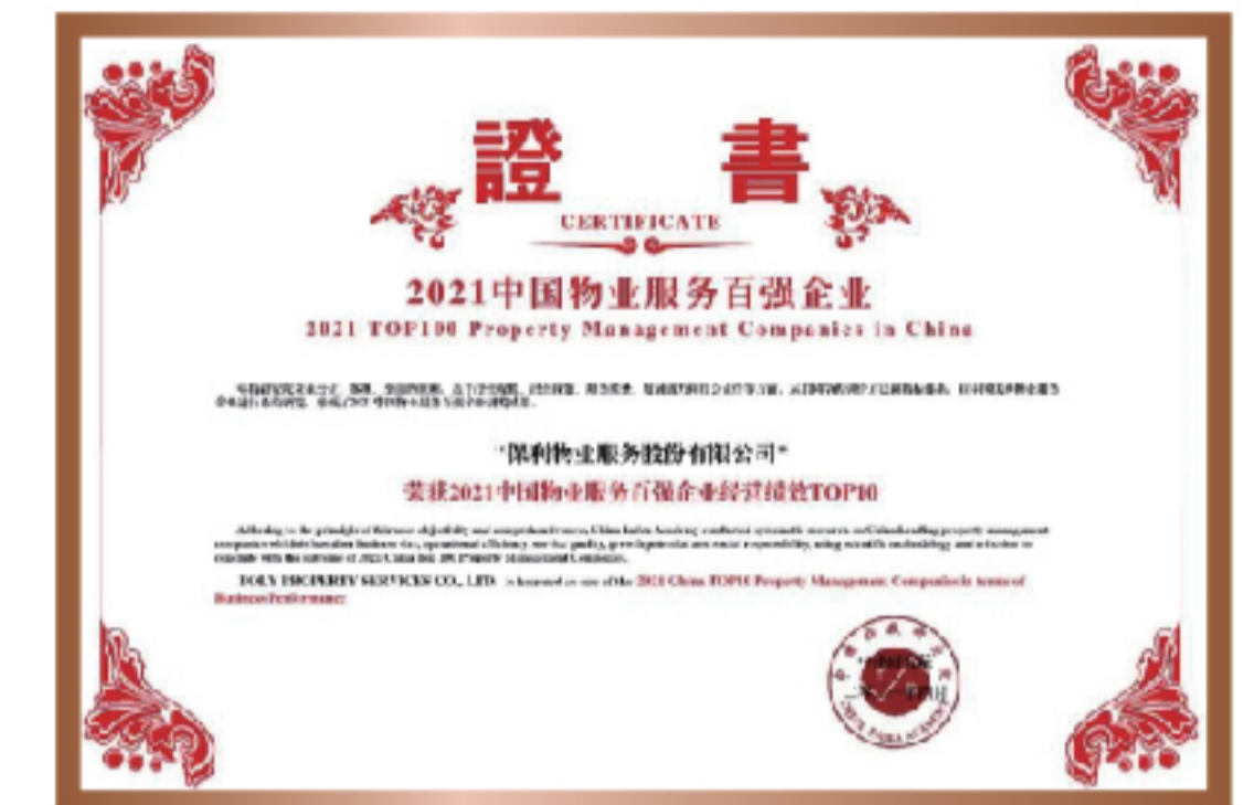
2021年 中国物业服务百强企业 经营绩效TOP10