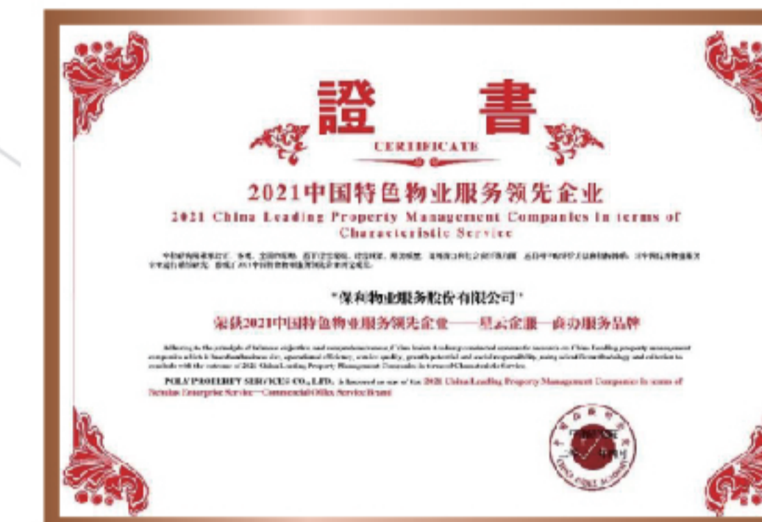
2021年 中国物业服务品牌 特色企业