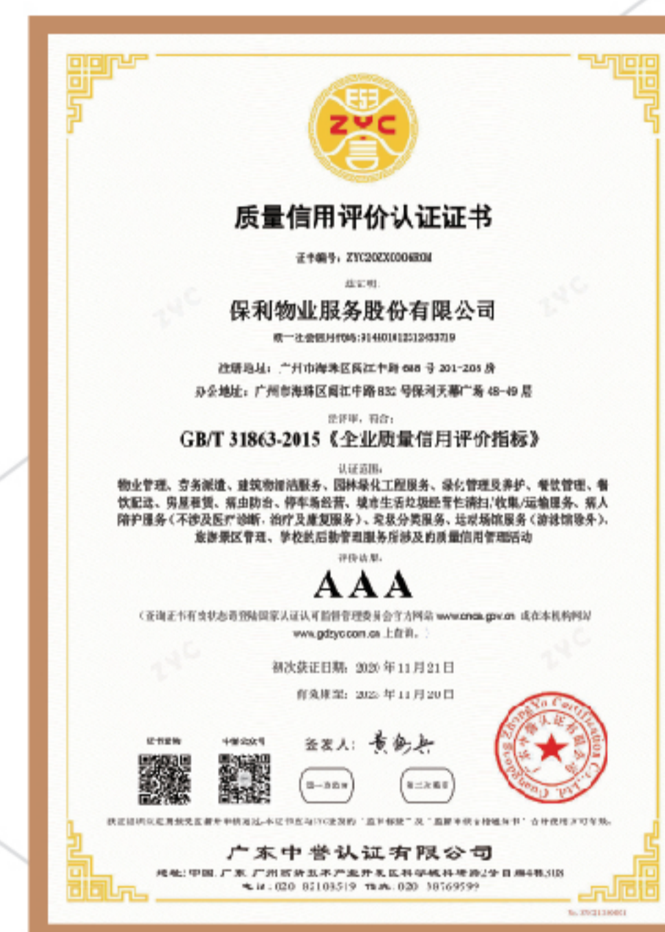
▲ 企业质量信用评价指标证书