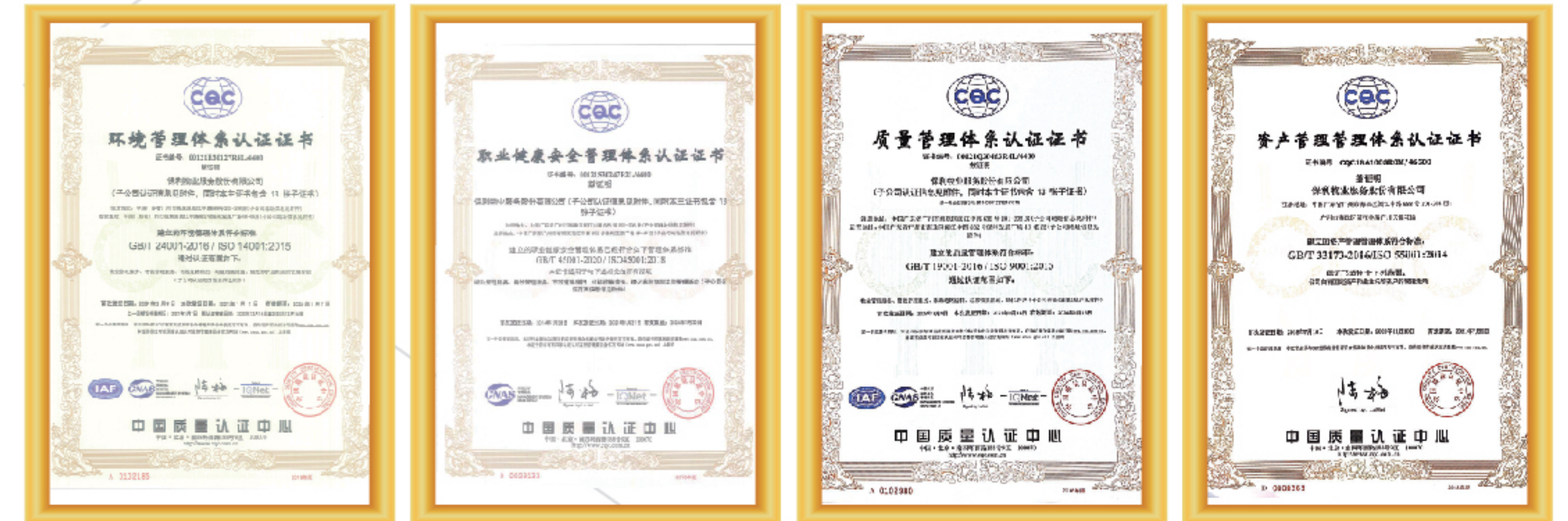
环境管理体系证书

保利物业构筑了“五标一体化”的质量管理体系为我们的日常服务活动提供全面的质量控制指导，保护客户信息安全和委托资产的保值增值，同时尽最大可能减少服务品质的不稳定给经营带来的干扰。