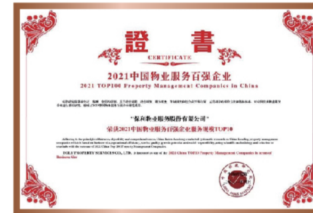
2021年 中国物业服务百强企业 服务规模TOP10