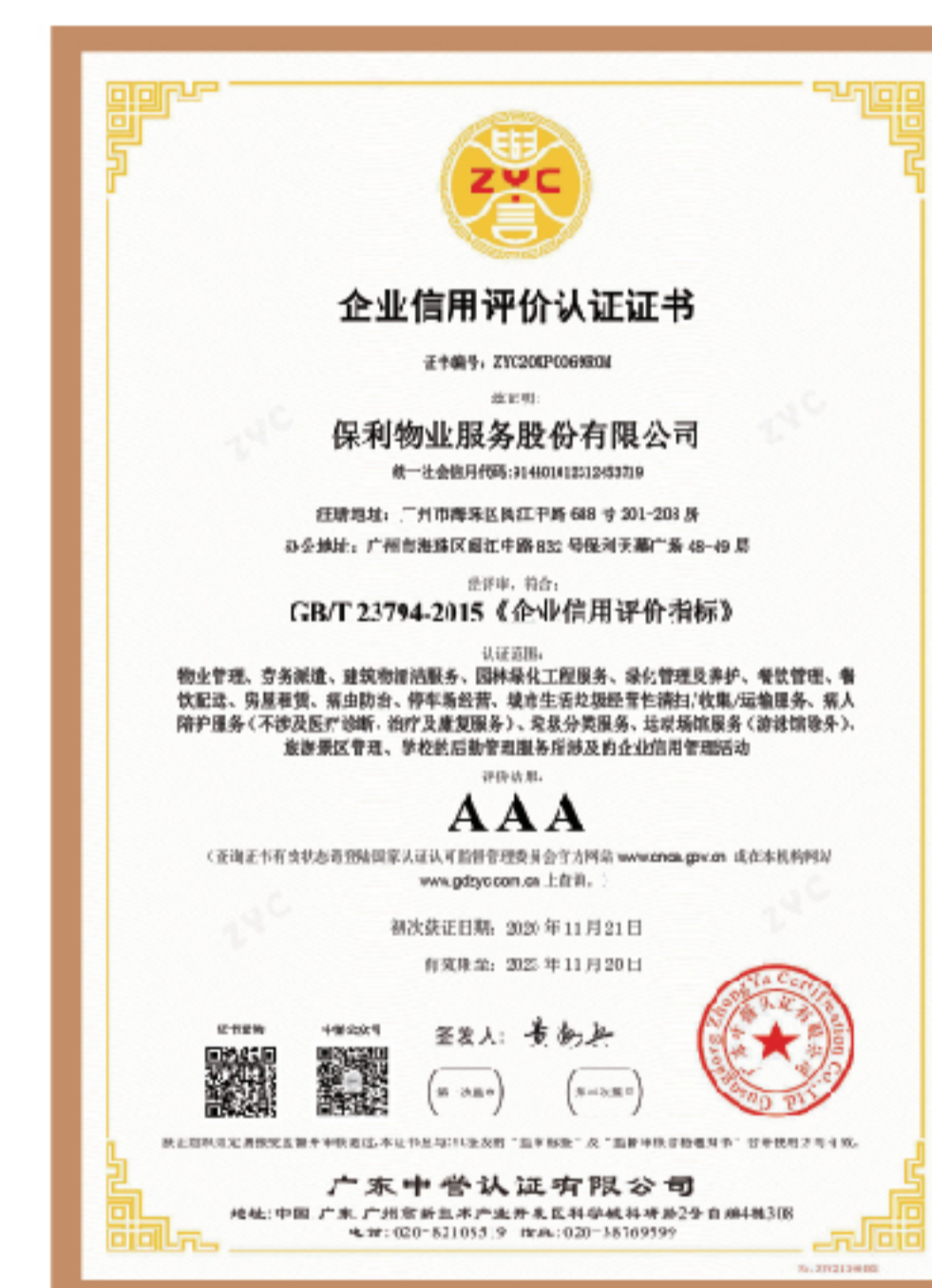
▲ 企业信用评价指标证书领先企业