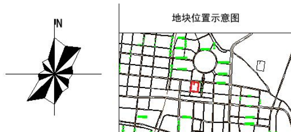
地块控制指标一览表