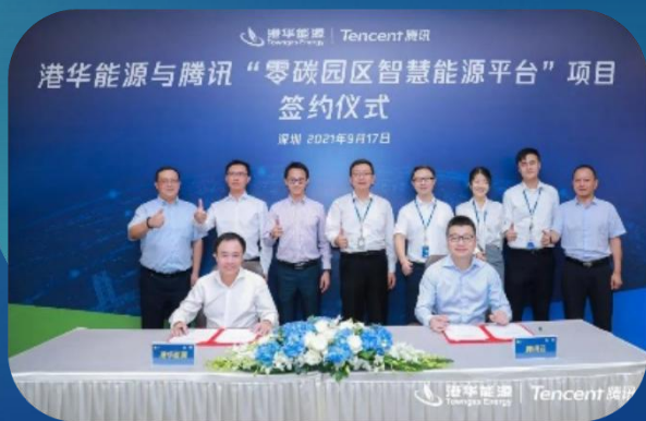
联合腾讯 构建区域级零碳智慧能源平台