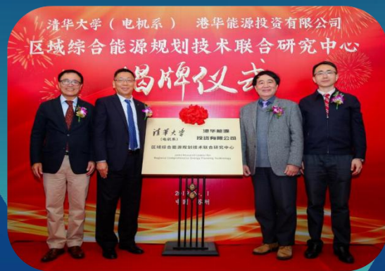
联合清华大学 成立区域综合能源规划技术联合研究中心