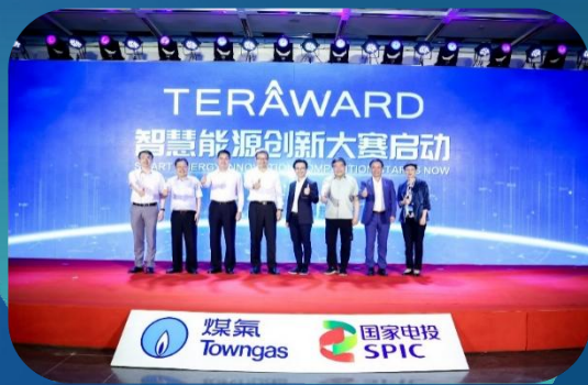
联合国家电投 全面开拓园区、交通、储能等零碳业务