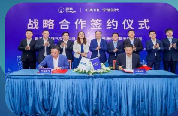
联合宁德时代 全面构建储能系统集成和数据运营能力