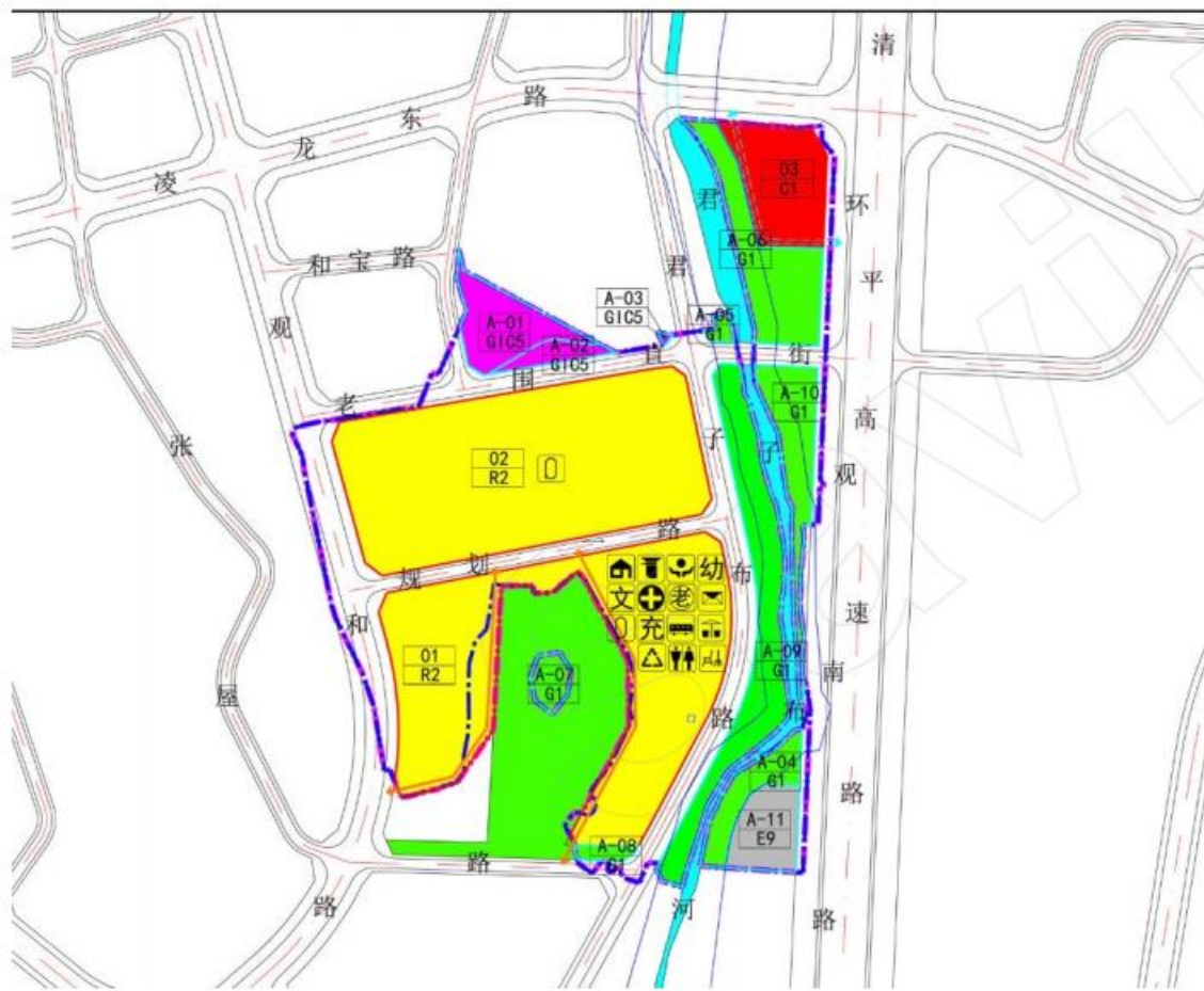
地块划分与指标控制图

规划用途主要为二类居住用地(R2)、商业用地(C1)和教育设施用地用地(GIC55)