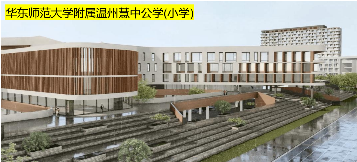
华东师范大学附属温州慧中公学(小学)