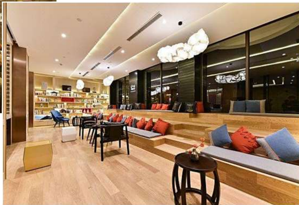
酒店餐厅、休闲区照片