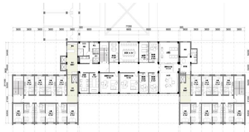
项目平面改造方案