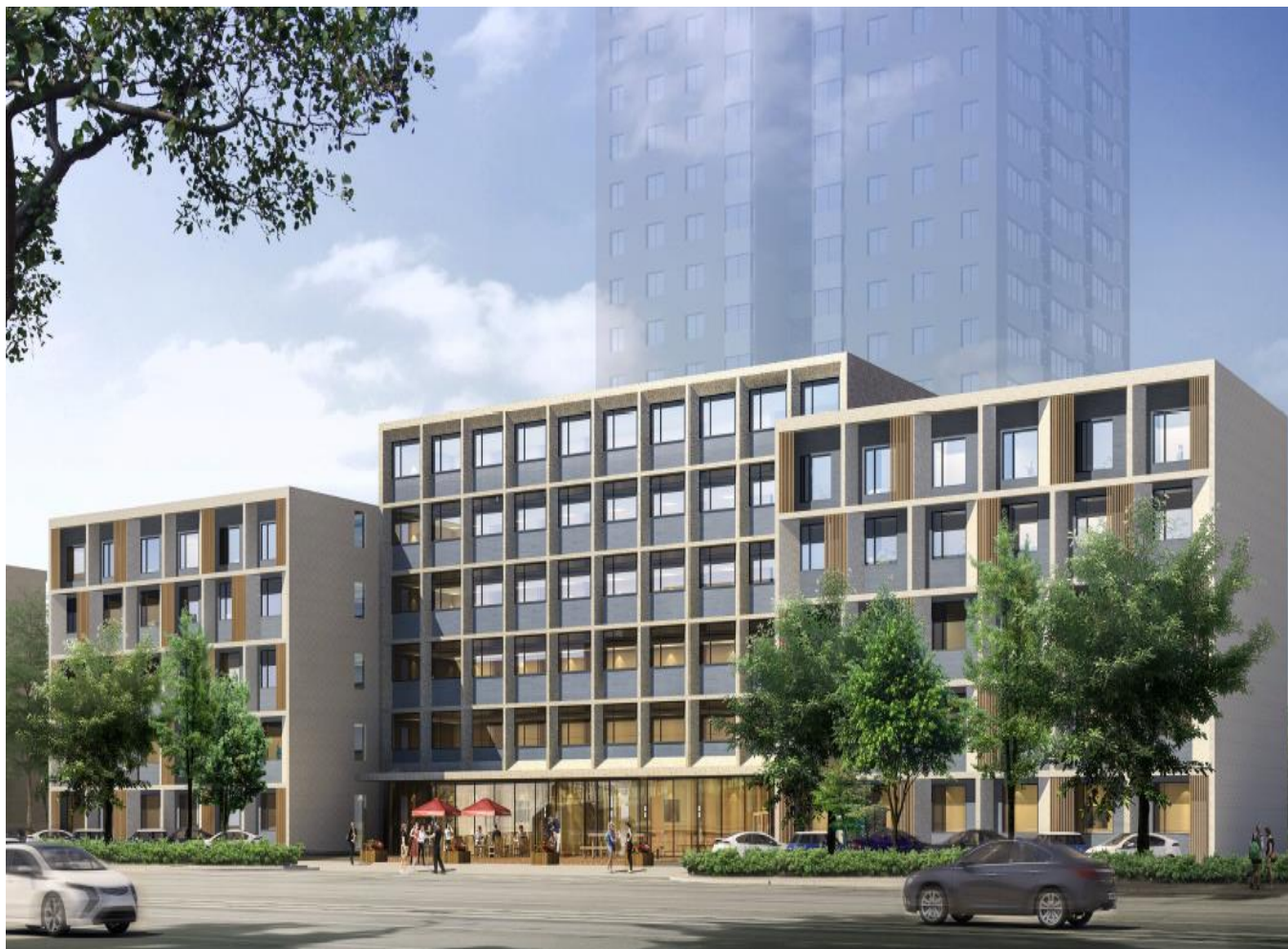
项目外立面效果图

翰德东辉资产管理有限公司 Hande Donghui Asset Management Co.,Ltd