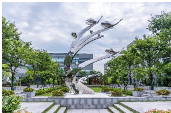
“壮志凌云”主题雕塑