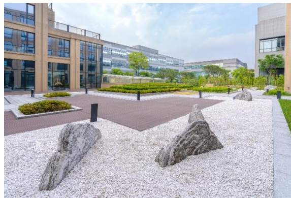
日式枯山水内庭院